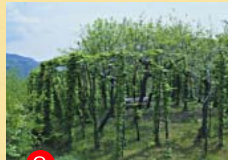
2 Roccol dal “Spizzo”

vissuta dal montanaro in simbiosi con l’ambiente circostante, anch’egli in gabbia per secoli. Una gabbia più grande, ma pur sempre gabbia; non sembra una contraddizione o una falsità che potesse