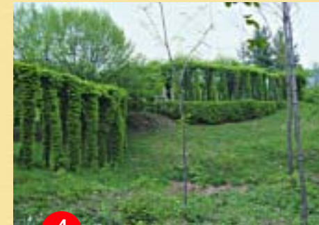
4 Roccol di “Pre Checo”

Sarà una festa gestita con grande semplicità con una ospitalità schietta e senza retorica in luoghi e con cibi i cui valori e sapori non potranno che essere apprezzati.