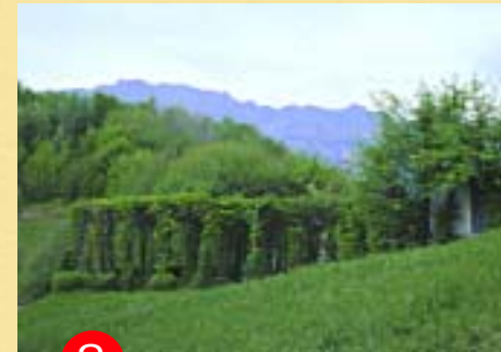
3 Roccol dal “Puestin”

di la giustificazione... Approvata la legge e chiusi i roccoli, ci fu, almeno all’inizio, un grande avvillimento. Che fare dei roccoli e dei richiami? questi furono liberati, mentre i primi furono abbandonati, quasi fossero loro la causa di tanta amarezza.