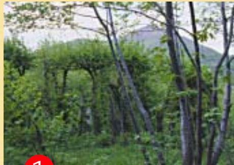
1 Roccol di “Manganèl”

Il vocabolario Zingarelli definisce il roccolo così: “tesa classica agli uccelli, con reti verticali disposte attorno a piante e boschetti opportunamente preparati in precedenza”. Questa definizione appare troppo scarna e frettolosa ai montenaresi, che all’uccellazione sono fortemente legati da secoli e ai roccoli, numerosi nel loro paese almeno da cent’anni. La